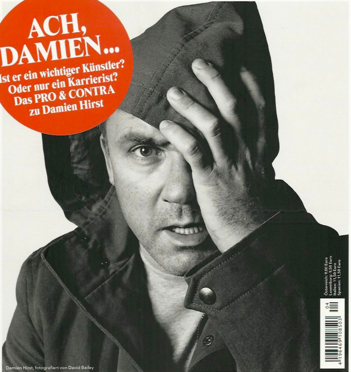
Damien Hirst, fotografiert von David Bailey

Ist er ein wichtiger Künstler? Oder nur ein Karrierist? Das PRO & CONTRA zu Damien Hirst